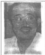
Tengku Razaleigh Hamzah

Konvensyen tiga hari akan berakhir dalam satu perbincangan