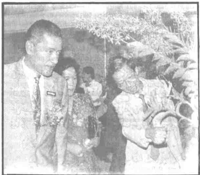
Hanya gambar hiasan

Itulah dia program Islam untuk mencapai cita-cita tinggi, tanpa tunduk kepada mana-mana pihak dan dihormati oleh rakyat negara-negara lain.