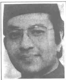
Datuk Seri Dr Mahathir Mohamad

Semenjak kebelakangan ini ada beberapa perkara yang berlaku yang menarik perhatian rakyat dan yang menonjol sekali dan ada yang tidak boleh dinafikan ialah Wawasan 2020 yang diilhamkan oleh Perdana Menteri, Datuk Seri Dr. Mahathir Mohamad. Ekoran dari itu boleh dikatakan tiap-tiap hari kita mendengar pemimpin-pemimpin negeri sama ada dari peringkat pusat ataupun negeri termasuk juga