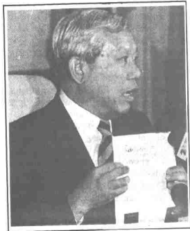
Hanya gambar hiasan

ADAKAH golongan akademik, cerdik pandai negara ini sudah bersedia untuk tampil ke hadapan dan memimpin negara ini ke arah wawasan 2020? Ataupun mereka masih mahu terus "ditarik-tarik hidung" mereka?