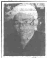
Haji Nik Aziz Nik Mat

"Insya Allah, saya memang hendak bertemu dan berunding dengan Perdana Menteri demi kepentingan bersama.