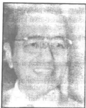
Datuk Seri Dr. Mahathir

DUA persidangan yang akan diadakan bulan ini membayangkan sokongan kuat masyarakat awam kepada Perdana Menteri dari beberapa kumpulan dan pertubuhan yang mewakili sektor-sektor ekonomi dan sosial di negara ini ekoran wawasan beliau menjadikan Malaysia negara maju menjelang 2020.