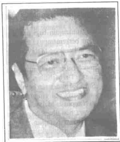
Dato' Sri Dr. Mahathir Muhammad

PERDANA Menteri Malaysia, Dato'Sri Dr. Mahathir Mohammad baru-baru ini telah mencabar rakyat Malaysia dengan Wawasan 2020 yang antara lain menyatakan hasrat beliau ingin melihat masyarakat Malaysia maju dan berkeyakinan terhadap diri sendiri dan berusaha ke arah kecermerlangan serta meletakkan nama negara setanding dan dihormati oleh negara-negara lain di dunia.