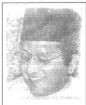
Dato' Seri Dr Mahathir

SETIAP pemimpin besar mempunyai wawasannya sendiri. Ia mudah dikesan melalui ucapan, tulisan, cara bertindak dan menganalisis sesuatu permasalahan. Umpamanya, untuk membangunkan negara, cara berfikir dan bekerja rakyat Rusia, Presiden Mikhail Gorbachev meletakkan wawasan 'glasnost dan perestroika' sebagai tunjang idea pembaharuan negara tersebut.