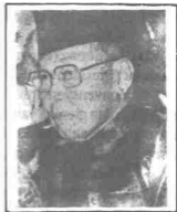
Tan Sri Ghazali Shafie