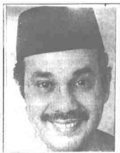
Syed Hamid Albar

Beliau juga berbangga dengan usaha ABIM mengadakan pameran Penggerak Kebangkitan Islam yang diharap akan dapat membangkitkan kesedaran umat Islam.