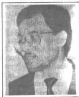
Datuk Seri Anwar

Pada tahun ini persatuan berkenaan telah memilih 'Rancangan Malaysia Keenam: Menuju Ke Arah Sebuah Negara Maju' sebagai tema konvensyen tersebut memandangkan pentingnya rancangan tersebut sebagai yang pertama di dalam enam siri rancangan pembangunan yang menjadikan negara ini sebuah negara maju menjelang 2020 seperti yang terkandung di dalam wawasan Dato' Seri Dr. Mahathir.