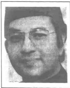
Datuk Seri Dr. Mahathir Mohamad

Wawasan berkenaan telah dikemukakan oleh beliau dalam mesyuarat pertama Majlis Perdagangan Malaysia pada 28 Februari lalu dalam kertas kerja beliau Ke Arah Masa Depan Malaysia yang mengandungi pandangan terhadap masa depan negara dan bagaimana kita boleh mencapai cita-cita Malaysia sebagai sebuah