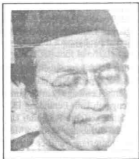
Datuk Seri Dr Mahathir Mohamad

PERDANA Menteri, Datuk Seri Dr. Mahathir Mohamad telah mengambil satu lagi langkah penting ke arah menjadikan Persyarikatan Malaysia, sebahagian dari visinya untuk menjadikan Malaysia sebagai sebuah negara maju sepenuhnya, setanding dengan negara-negara lain menjelang tahun 2020.